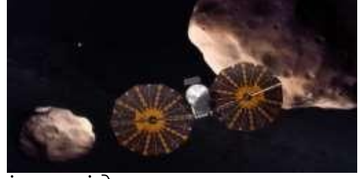
રિલીઝમાં જણાવાયું છે.